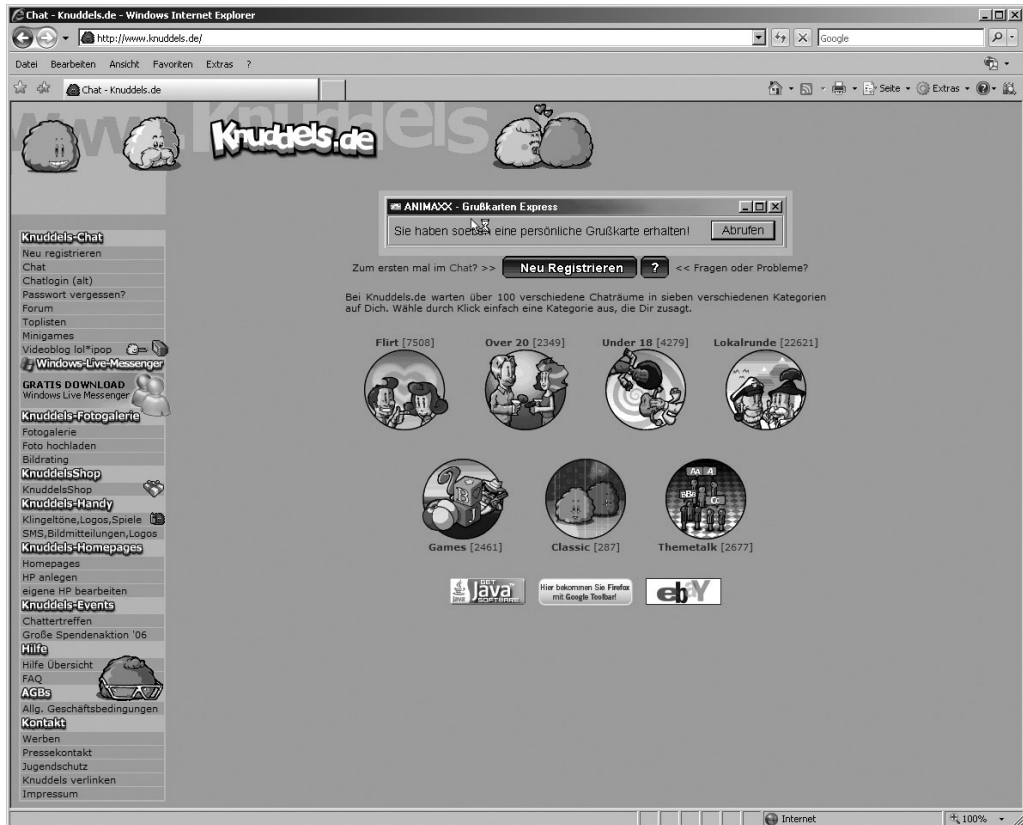
Abbildung 1: Startseite einer Chat-Homepage für Kinder und Jugendliche (www.knuddels.de)

<#steffi#> du bist 10 <jonas10> ja und du? <#steffi#> 14 <#steffi#> ich such was intimes <jonas10> was heißt das <#steffi#> na ja wie soll ich dir das sagen <jonas10> sag mal <#steffi#> wixt du manchmal? <jonas10> nein <#steffi#> ist dein pimmel manchmal steif? <jonas10> ja <#steffi#> dann nimmst du ihn in die Hand und machst hin und her mach einfach mal